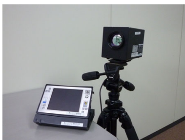
写真1 撮影システムの例

図2にANR処理の概要を示す。赤外線センサの性能に影響する長周期ノイズは、図2①に示す破線で示されるような、通常固定パターンとして現れる。シャッターを閉じた際にも、この固定パターンノイズは②のように消えることがない。そこで、この固定パターンノイズを差分することで、③のようなノイズのない鮮明な画像を得る技術である。