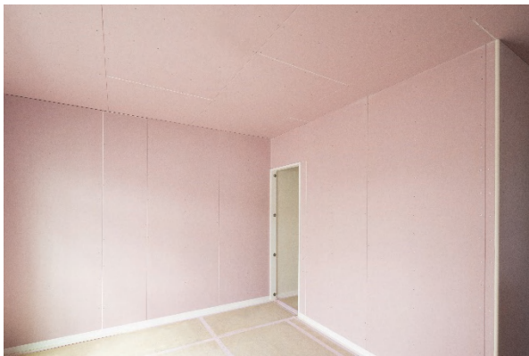
写真1 ハイクリンボードを壁、天井に施工した室内(仕上げ材施工前)

タイガーハイクリンボードは、建築物の内装用下地材や内装材として広く使用されているせっこうボードの優れた性能を保持したまま、室内空气中のホルムアルデヒドを吸収分解し、ホルムアルデヒド濃度を低減する建材である。吸収分解したホルムアルデヒドを再放出しないこと、室内空気を汚染する新たな化学物質を放散しないことが試験により確認されている。