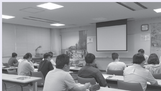
IYSHハウジング・セミナーの様子