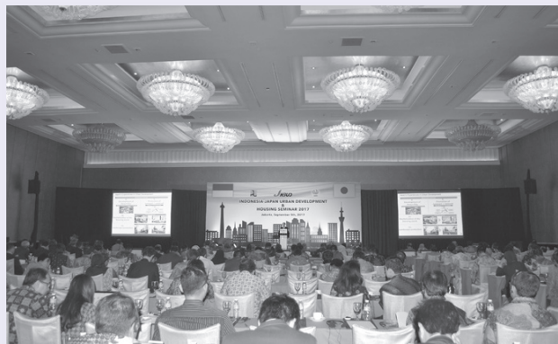
Indonesia-Japan Urban Development and Housing Seminar 2017