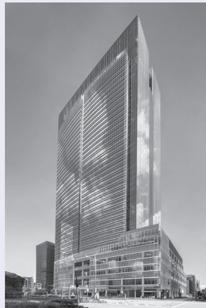
東京ミッドタウン八重洲