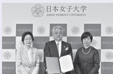
日本女子大学に寄附授業を開設