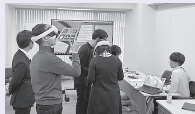
VRを使用した任意検査