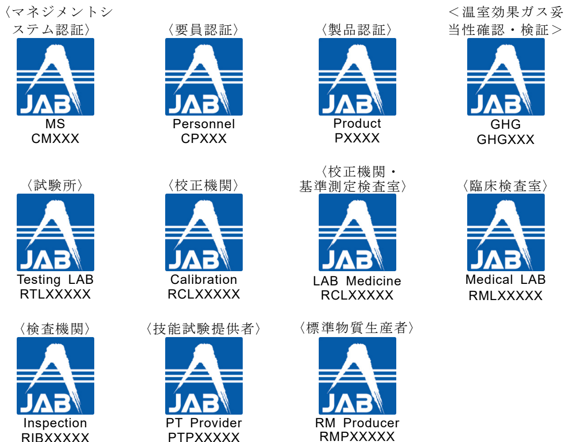
図4 新認定シンボル

認定スキーム毎の認定シンボルを図4に示す。本協会は、認定スキーム略称及び認定番号を含む認定シンボルの電子データを適合性評価機関に支給する。