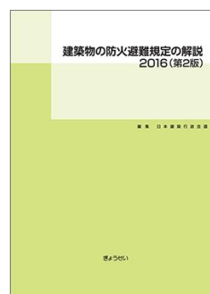
<テキスト1> 「建築物の防火避難規定の解説2016(第2版)」 発行:(株)ぎょうせい

併せて、「プロのための主要都市建築法規取扱基準(四訂版)」から主要都市における個別的な防火避難基準等もご紹介しますので、地域により異なるケースに対処するための知識やヒントを学ぶことができます。