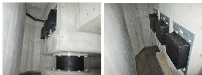
写真1 免震フェンダーの設置状況例