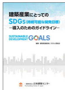
建設産業にとってのSDGs (持続可能な開発目標) 一導入のためのガイドライン

日本建築センター発行・編集・企画の刊行物を割引価格で購入できます。また、送料も一律一箇所300円(税込)です。