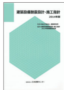
建築設備耐震設計・施工指針2014年版 他、約60種を割引