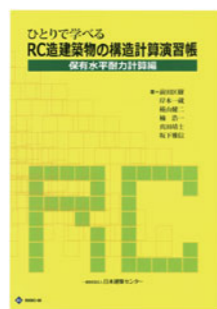
BCJ Books-8 ひとりで学べるRC造建築物の構造計算演習帳【保有水平耐力計算編】