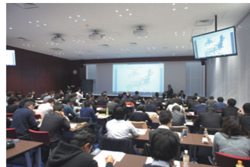
技術セミナー「基礎から学べる構造設計シリーズ」

対象のセミナー・講習会は、ビルディングレターと情報交流会メールマガジンで随時お知らせいたします。