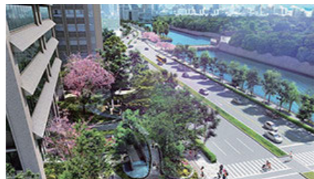
ホトリア街区(千代田区大手町)における「ホトリア広場」及び「皇居外苑濠水の浄化施設」等の見学会(2018.3開催)

話題の建築、最新の構・工法技術を用いた現場を開発者・設計者のご協力により、その担当の専門家から直接説明いただく見学会を行っています。