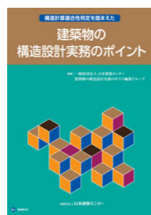
BCJ Books-10 構造計算適合性判定を踏まえた建築物の構造設計実務のポイント